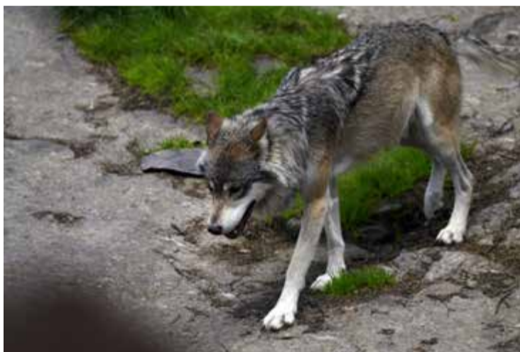
I ett avlyssnat samtal kallade företagsledaren vargen för gråben.

Hovrätten beslutade på fredags-eftermiddagen att mannen ska bli kvar i häktet. I överklagandet framgår att mannen har ringt en närstående och talat om gråben, ett gammalt öknamn för varg. Han pratar även om att han varit ute med "ett gäng". Sven Severin skriver att företagsledaren vis-