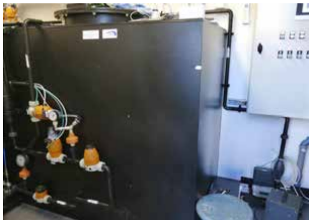
Reaktorn är själva hjärtat i reningsprocessen.

ra idén om fler projekt hos Södertälje kommun men det var inte riktigt i linje med kommunens idéer enligt Anna.