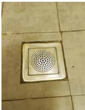
Igenproppade golvbrunnar kan vara svåra att få rena på traditionellt vis.