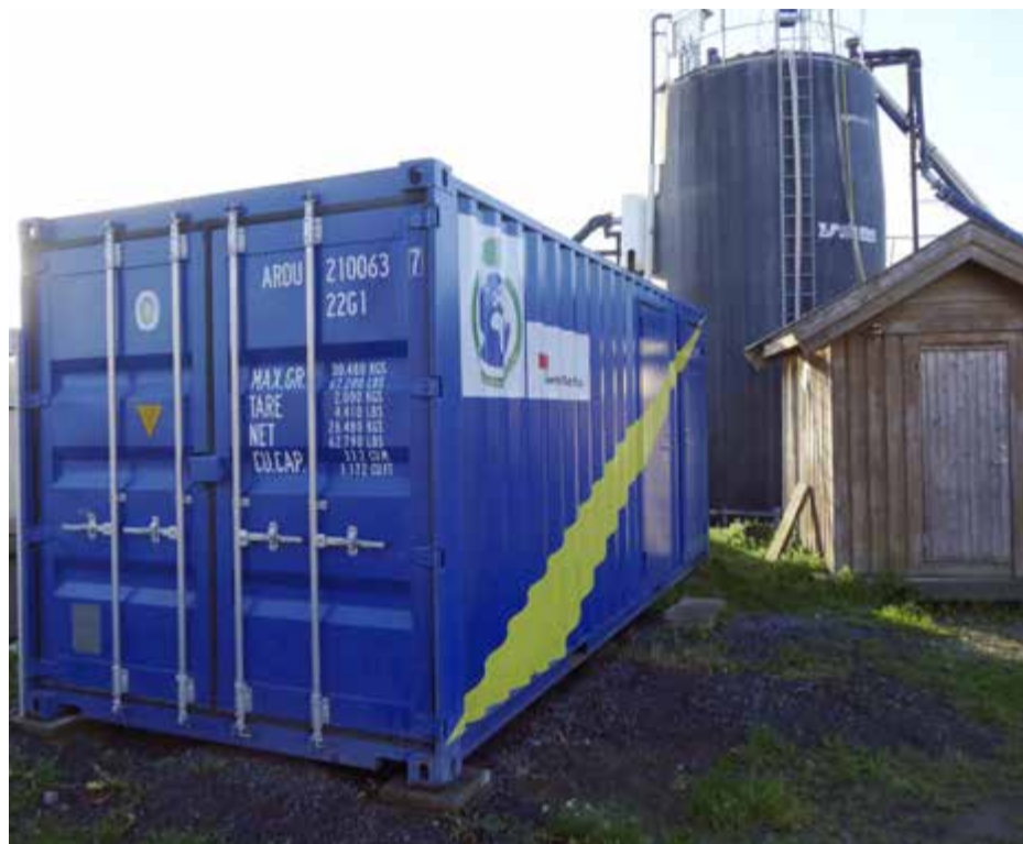
Containern är det nytvecklade portabla reningsverket som kan användas vid exempelvis naturkatastrofer eller i flyktingläger. I bakgrunden syns silon där experimenten började. Den är dock fortfarande igång.