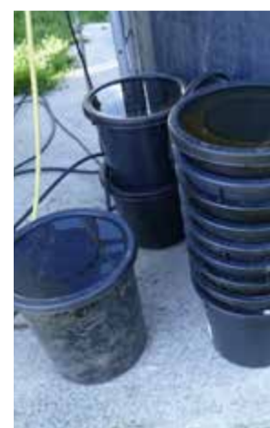
Nu körs latrinavfall från 25 kommuner till Sörby gård.

– I Hölö utanför Södertälje hade man länge känt till ett övergödningssproblem i sjöarna Lillsjön och Kyrksjön. Det är ett sommarstugeområde och här var det länge ett byggstopp. Det var för långt för att bygga ett kommunalt va-nät. Man såg hur kostsamt det skulle bli slå ihop de två problemen – byggstoppen och övergödningen – så man bestämde sig för att söka ett alternativ, berättar Anna.