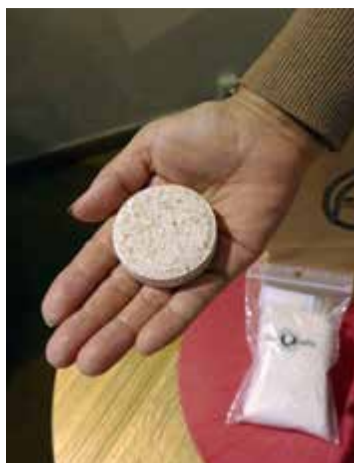
Produkten finns både i tablett- och pulverform.