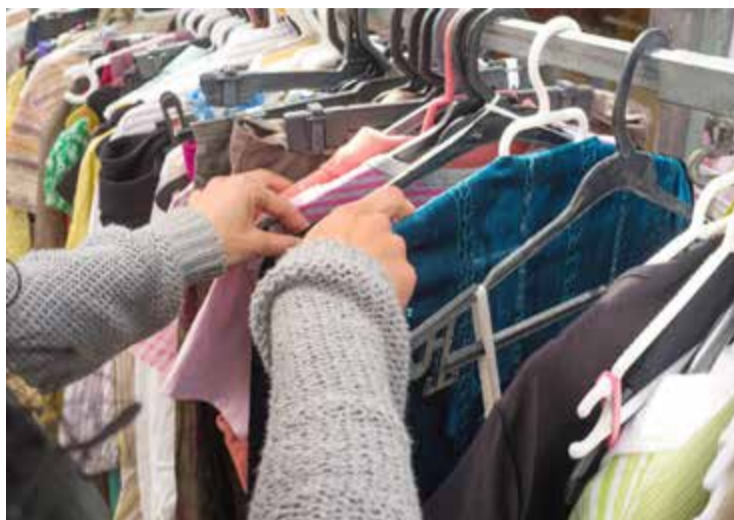
Årets julklapp har utsetts av HUI Research. Det återvunna plagget är Årets julklapp.

eller ha fått ett nyväckt intresse under året.