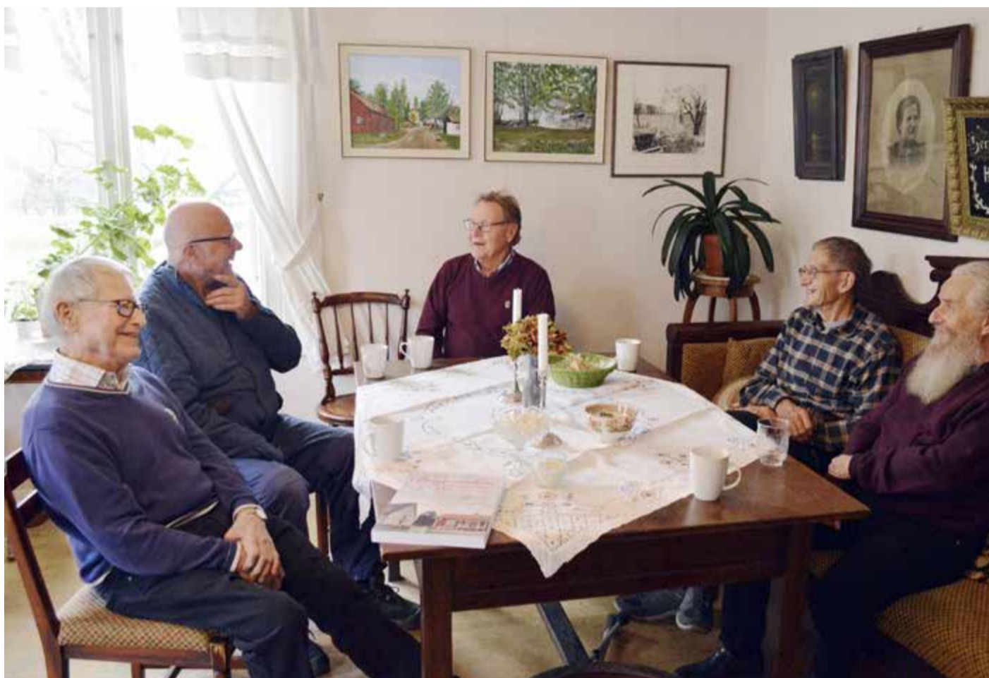
Svedvi-Bergs hembygdsförening är nöjda med resultatet av sin nya bok - Bergs socken under 1900-talet.