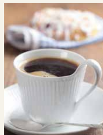
Kaffe med hembakat serveras på helgens marknad och julloppis.