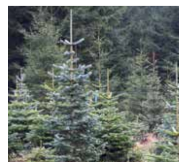
Sommarens torka har fått granarna att mogna till en fin grön färg.