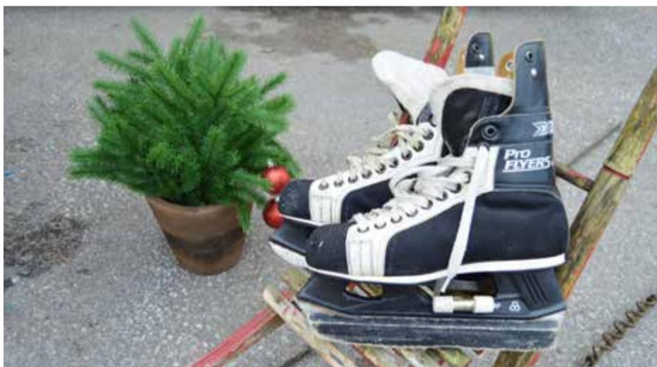
Skridskor i begagnat skick men fullt användbara ändå.