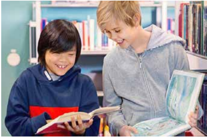
Kulturrådet genomför en satsning för att stärka landets folkbibliotek. Syftet är bland annat att öka utbud och tillgänglighet.