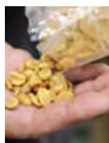
Ny studie ger hopp för jordnöttsallergiker.

Fler än 550 patienter i olika åldrar, som deltog i den aktuella studien, lottades till att antingen få jordnöttsprotein el-