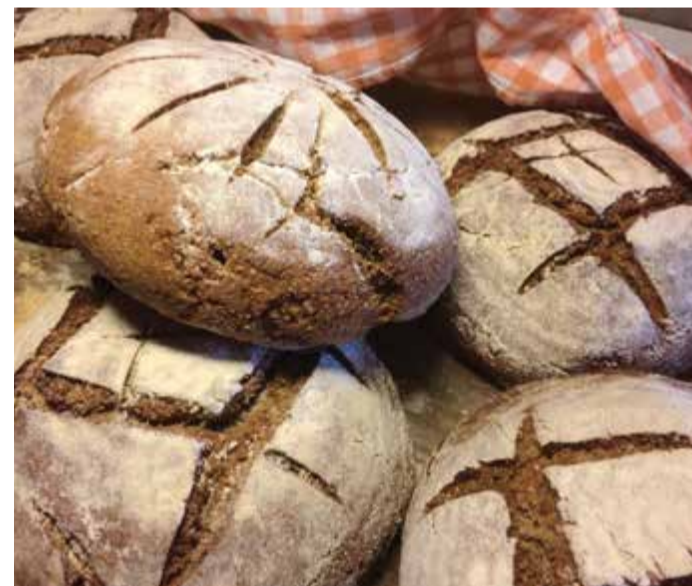
I ett forskningsprojekt ska man bland annat titta på kultursorternas näringsinnehåll och lämplighet för brödbakning. På bilden är det surlimpa från Lövsta.