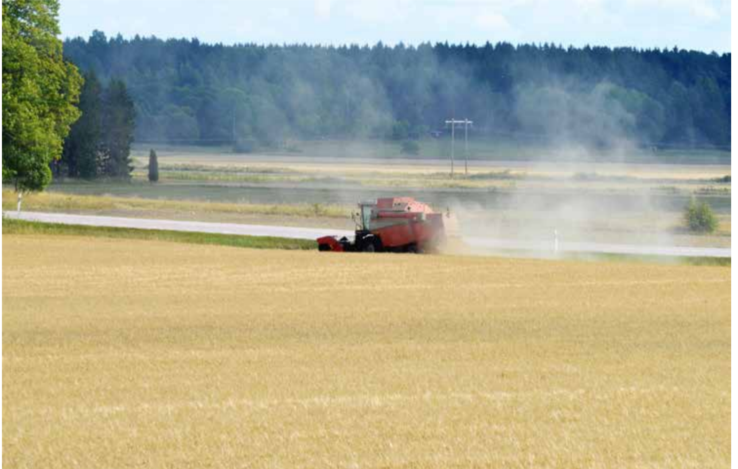
Sverige brukar vara självförsörjande på spannmål men torkan har bidragit till att skördesiffrorna är på rekordlåga nivåer.

Blir det prisökningar även i konsumentledet?