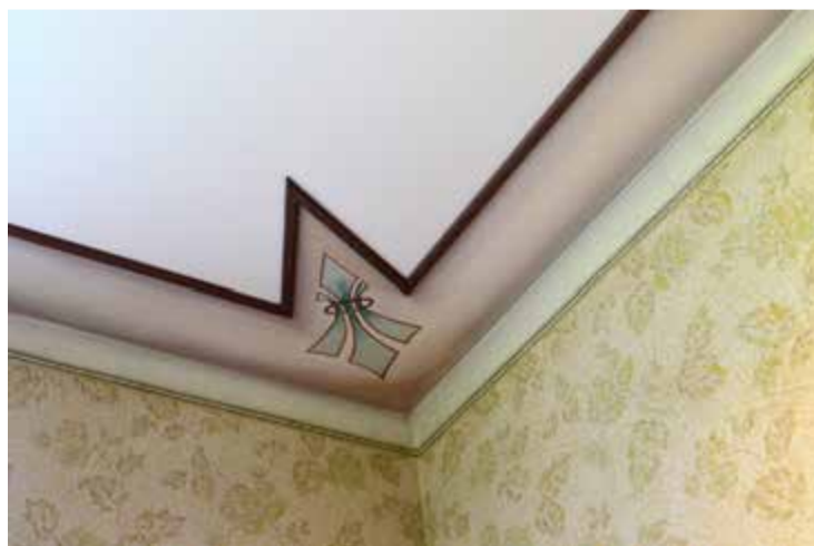
I Josephinas hus är de gamla takmålningarna bevarade.