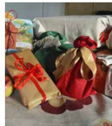
Tänk nytt. Julpappret kan exempelvis bytas ut mot tyg, tidningspapper eller en handduk, som blir en bonuspresent.

»Sy till exempel påsar av tyg, som kan återanvändas, eller slå in i en handduk eller i tidningspapper.«