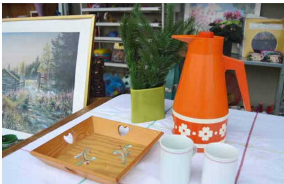
En retro kaffetermos kan vara ett åtråvärt byte.