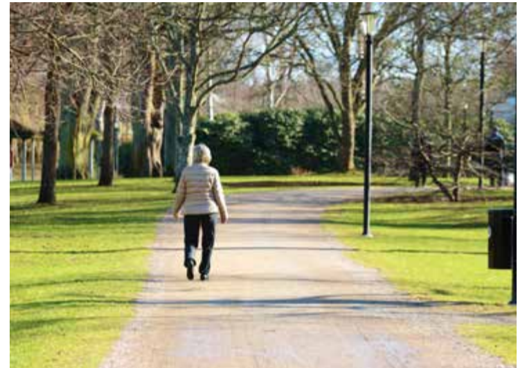
Vår kondition är skrämmande dålig vilket kan leda till hjärt- kärlsjukdomar och typ 2-diabetes.

– Detta är en av första och största enskilda studierna, både i Sverige och internationellt, som visar på en dramatisk försämring