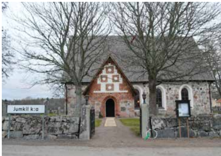
På söndag, 25 november, är det återinvigning av Jumkils kyrka som varit stängd i över två år.

Nu är arbetet slutfört och på söndag, 25 november klockan 10, förrättar biskop Ragnar Persenius en återinvigningsmessa. Barn från bygden kommer att medverka, invigningskören sjunger och