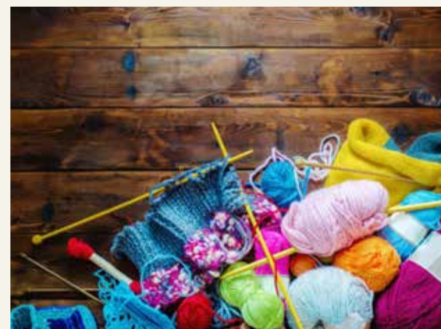
Stickcafé för alla blir det på biblioteket i Skutskär på lördag förmiddag och onsdag kväll.