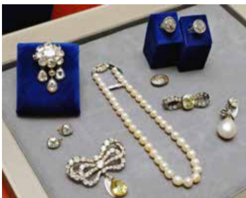
Dyrgriparna har ingått i en samling ägd av huset Bourbon-Parma, som har historiska kopplingar till flera europeiska kungligheter.