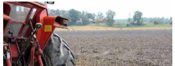
Förslaget i utredningen "Ett snabbare bostadsbyggande" innebär att markägare inte ska få någon ersättning för mark som exproprieras.

Den tillfällige bostadsministern i övergångsregeringen Peter Eriksson, MP, ställer sig dock tveksam till utredningens förslag, och kommer i nuläget inte att lägga fram förslaget.