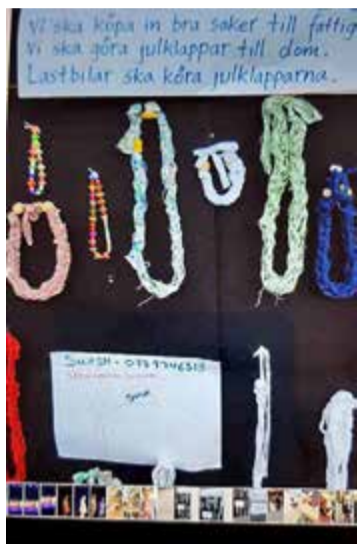
Egen tillverkning av klassen

Paketet består av en julklappskartong med ritblock, kriter, godis, tvåål, tandkräm och tandborste.