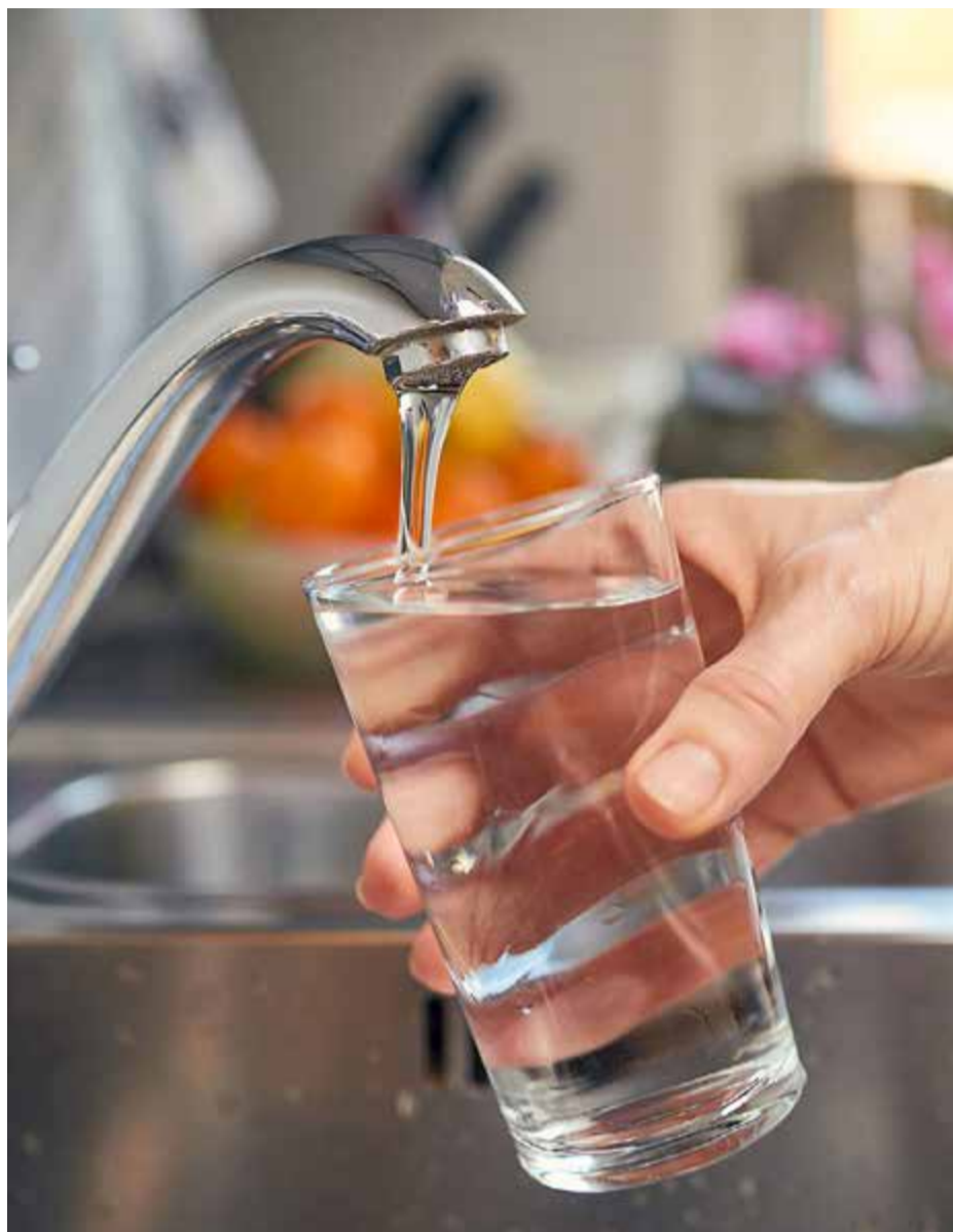
Endast två kommuner – Eskilstuna och Nyköping – har planer och skyddsåtgärder för att säkra den framtida vattenförsörjningen.