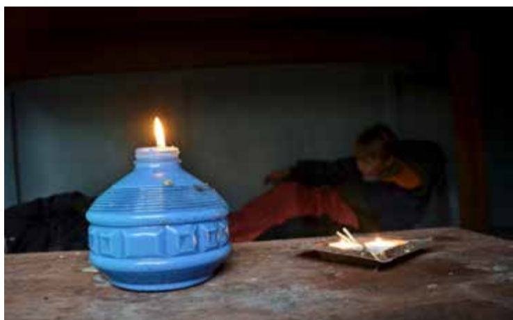
Det blir snabbt kväll utan elektricitet.