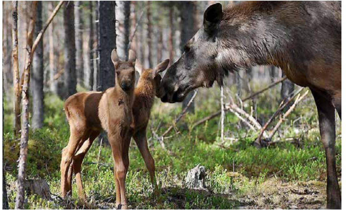
Skogsstyrelsen skriver i en nypublicerad rapport att älg och annat klövvilt ska minskas.

GÖR DIN RÖST HÖRD! Skicka dina åsikter till redaktionen som debattinlägg eller insändare. Skriv ditt inlägg och skicka med e-post till: sorlandsbygden@sveagruppen.se eller skicka med post till: Sörmlandsbygden, Box 145, 641 22 Katrineholm.