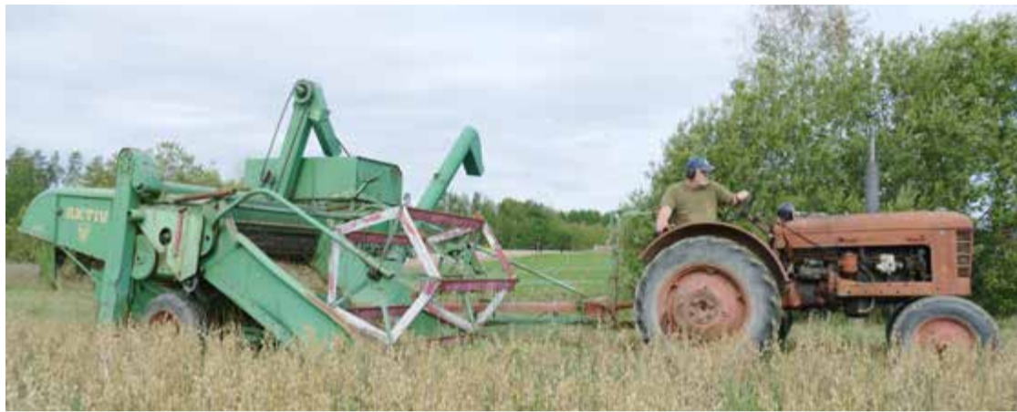
Det går fint med den gamla T-24 om det inte bli för bra spannmål, då går det för tungt.

Efter några år tillverkade Aktiv även en självgående tröska. Den