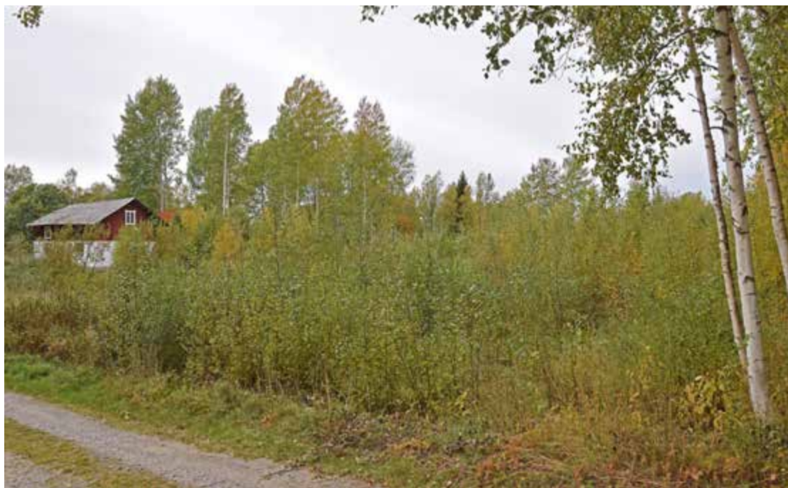
Betande djur är en förutsättning för ett öppet landskap och mångfald. Finns inga djur blir snart resultatet det här.

stor potential att öka antalet hektar i form av betesmarker. I samma rapport konstateras att det råder viss obalans mellan betande djur i delar av landet. I södra Sverige är det ont om betande djur medan det i norr finns betydligt mer men att kostnaderna är högre för att få ut djuren på den totala tillgängliga betesmarken. Det är här risken finns att stora