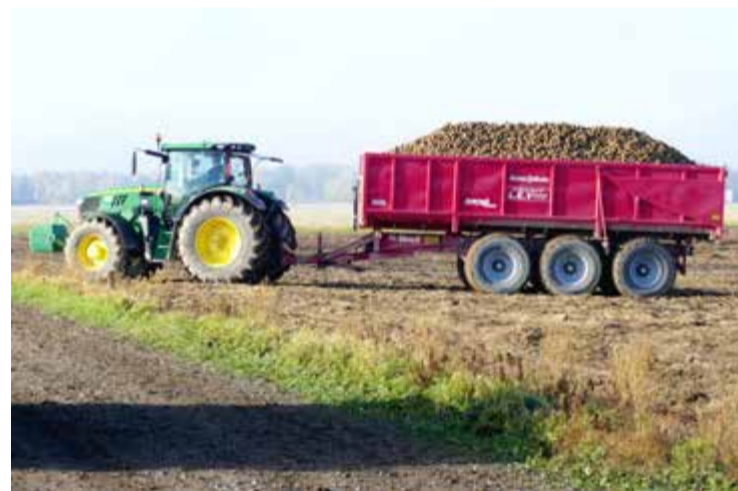
Potatis körs från Säbylund utanför Kumla till packeriet i Stora Mellösa, i Östra Närke, med fem sådana här ekipage, i skytteltrafik.

- Vi kör med potatis vart sjätte år på samma skifte. Det gör ju att det krävs mycket mark i omlopp för så här pass stor potatisodling. Alla mark passar inte