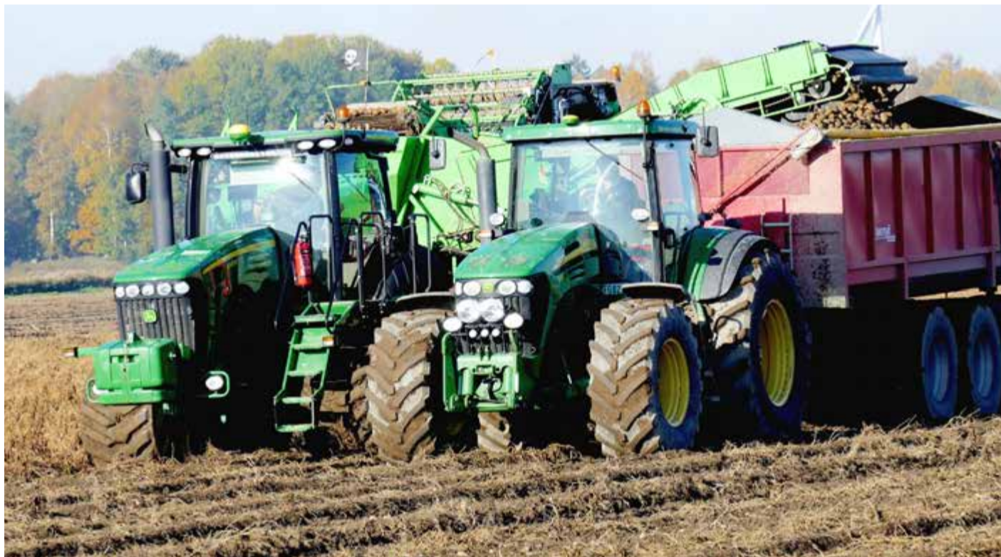
Potatisskörd på de låglänta markerna vid Mosjö, nära Kumla i Närke.