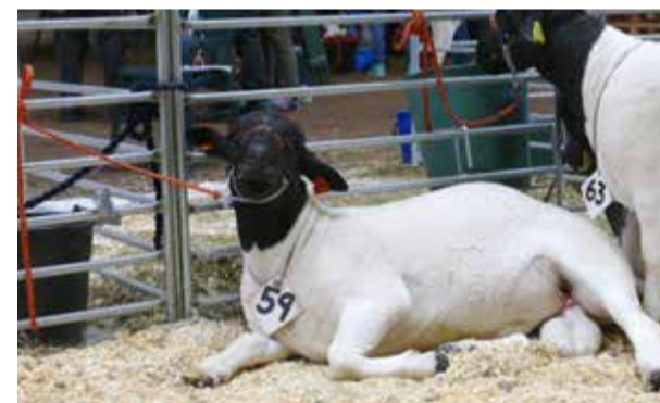
Dorper är en relativt ny ras inom Svensk lammproduktion. Speciell med sitt svarta huvud. 7 baggar såldes på auktionen.