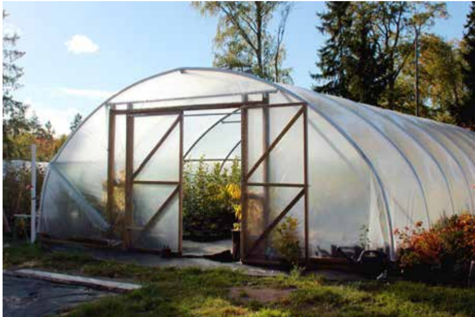
I odlingstunneln drivs grönsaksplantorna upp.

» Vi försöker hålla ett brett sortiment som både är ätbart och vackert.