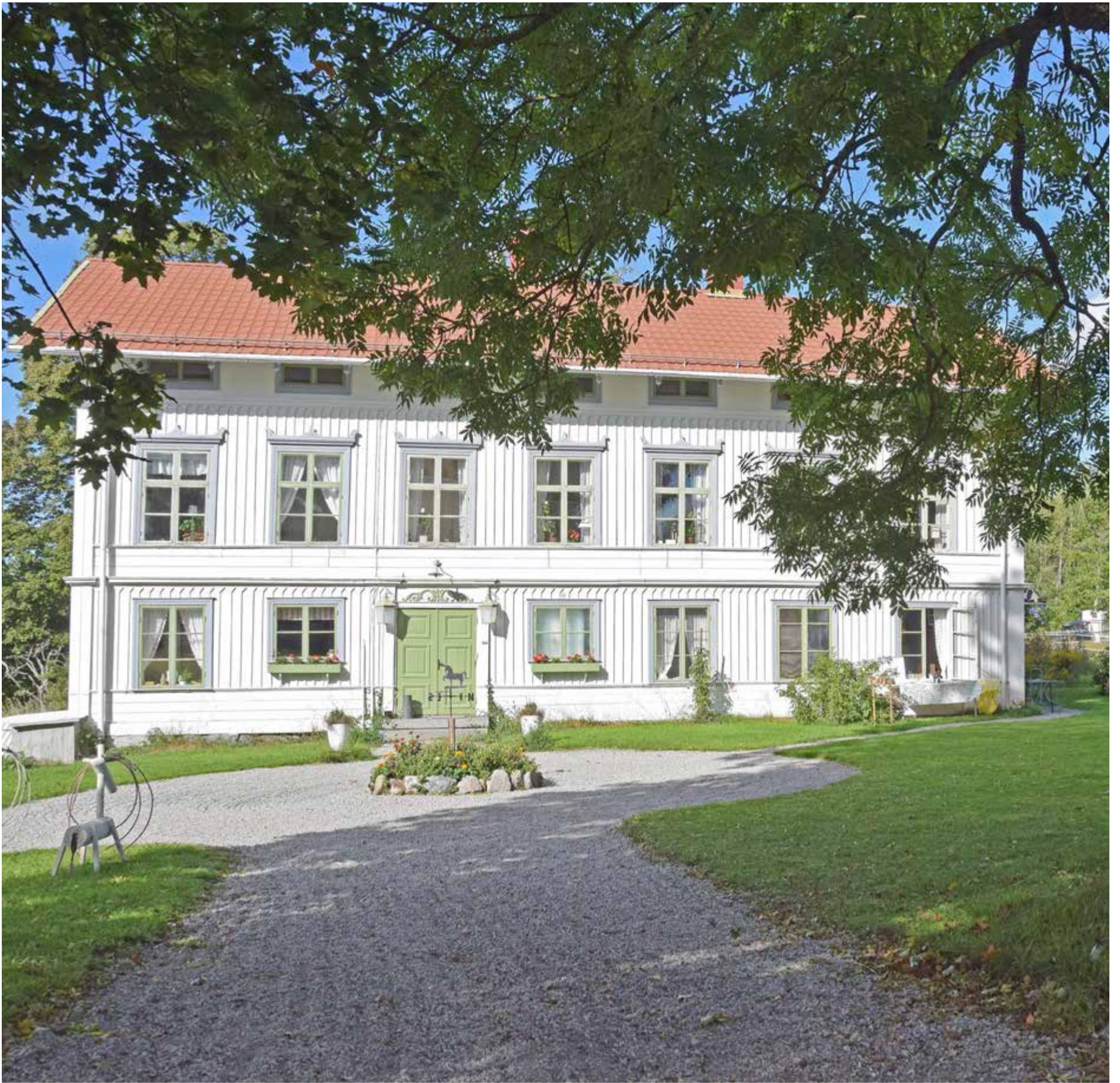
Myskje gård som tidigare var ett gästgiveri men nu en familjebostad.