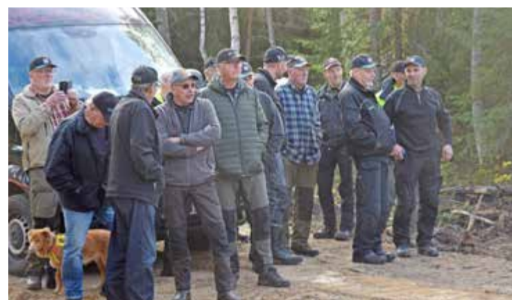
Skogsägare som fick praktisk information om att bygga skogsvägar.

En bra byggd skogsväg med hög bärighet underlättar dessutom virkestransporter under pe-