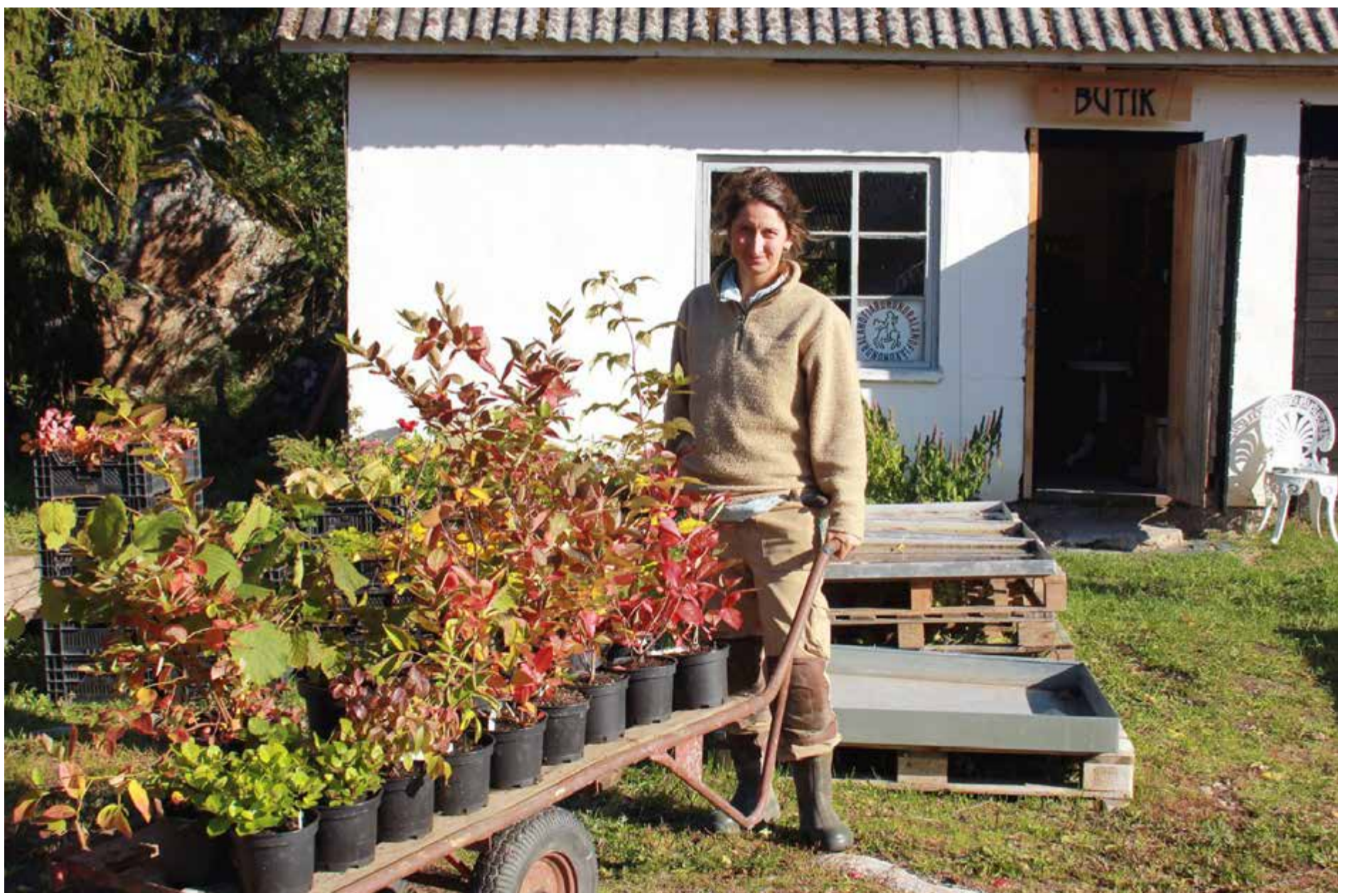
Gårdsbutik och ätbara buskar är en del av Svartbäckens Trädgård.

I våras sattes en odlings-tunnel upp och efter att grönsaker och snittblommor flyttat ut på friland huserar här en mängd olika