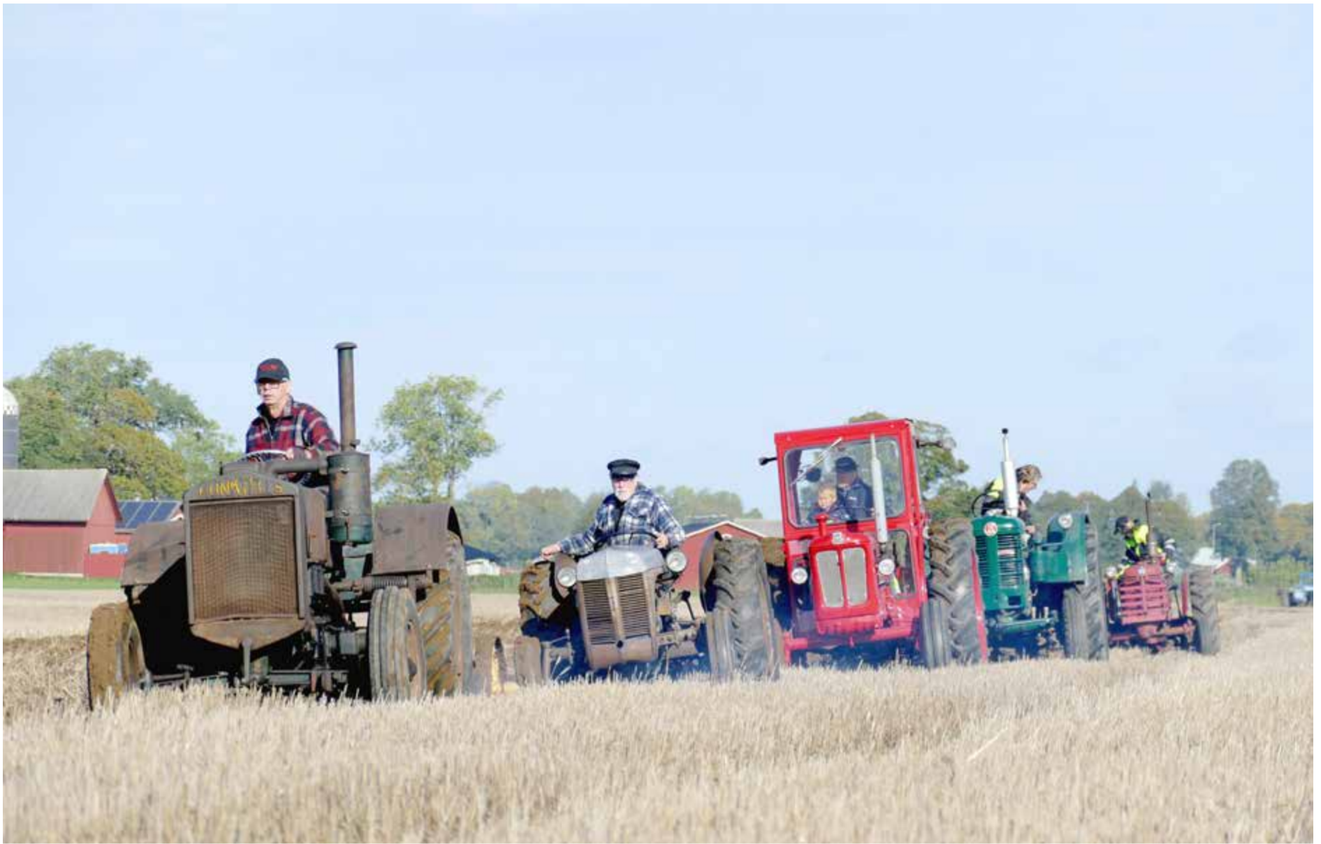
En rejäl bredsälva vänder jord. En Bolinder Munktells modell 2, Ferguson Ted 20 (grålle), Volvo BM 320, Bolinder Munktells 36 samt längst bak, en ovanlig italienskbygd International Harvester