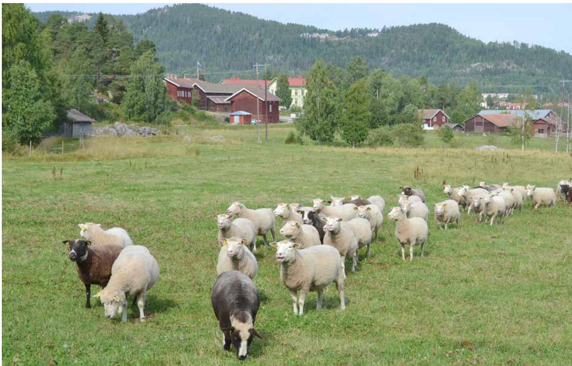
Det finns gott om exempel på igenväxta betesmarker i Dalarna. Marker som skulle kunna ge foder åt exempelvis får.