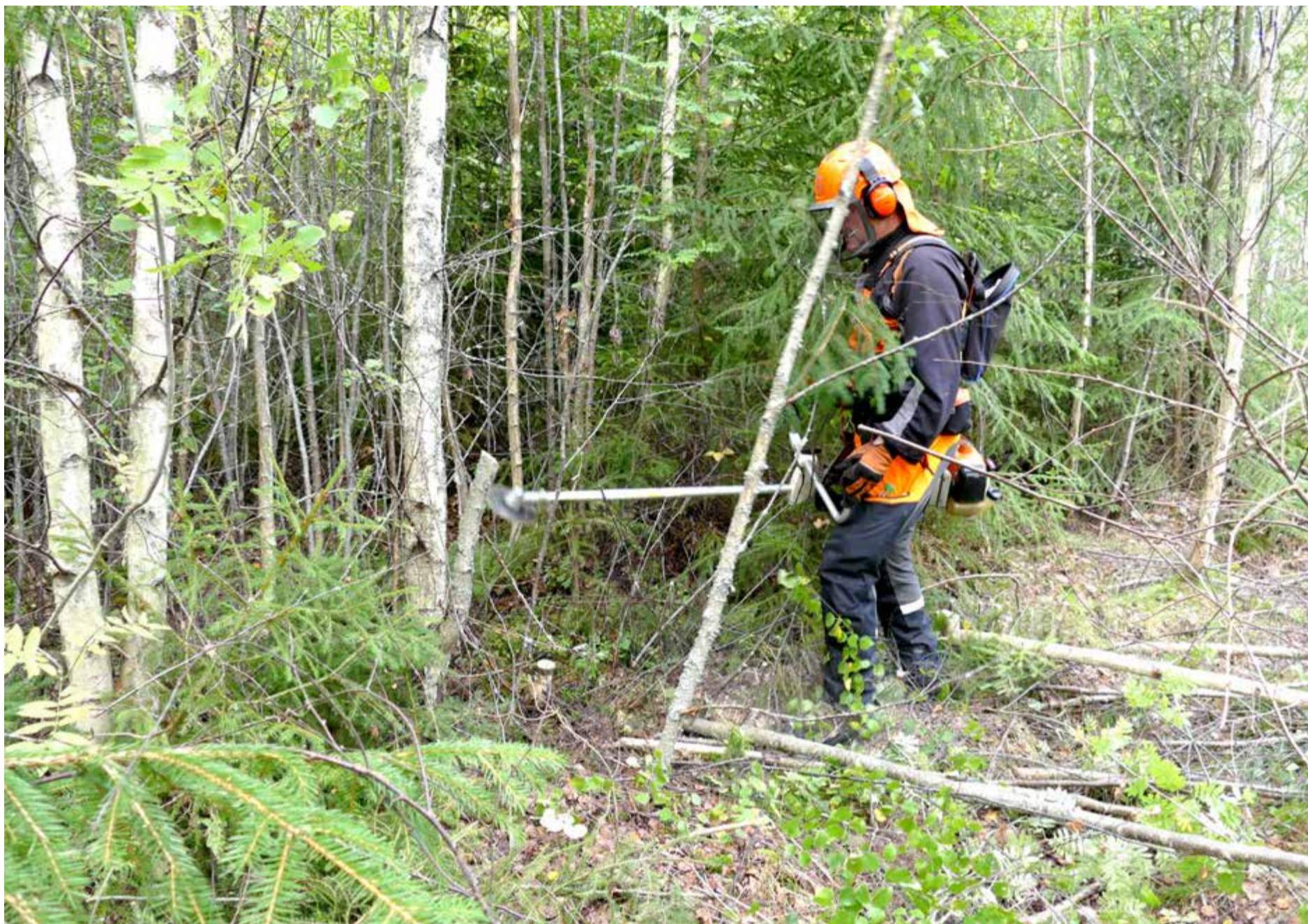
Tommy Jansson går in i "väggen" av mycket tät, orörd skog. Att få stammarna att ramla åt rätt håll, så man kan ta sig fram smidigt är en av utmaningarna. Han har med sig två röjsågar. En stor, lite tyngre, och en lättare smidigare, för lättare röjning.