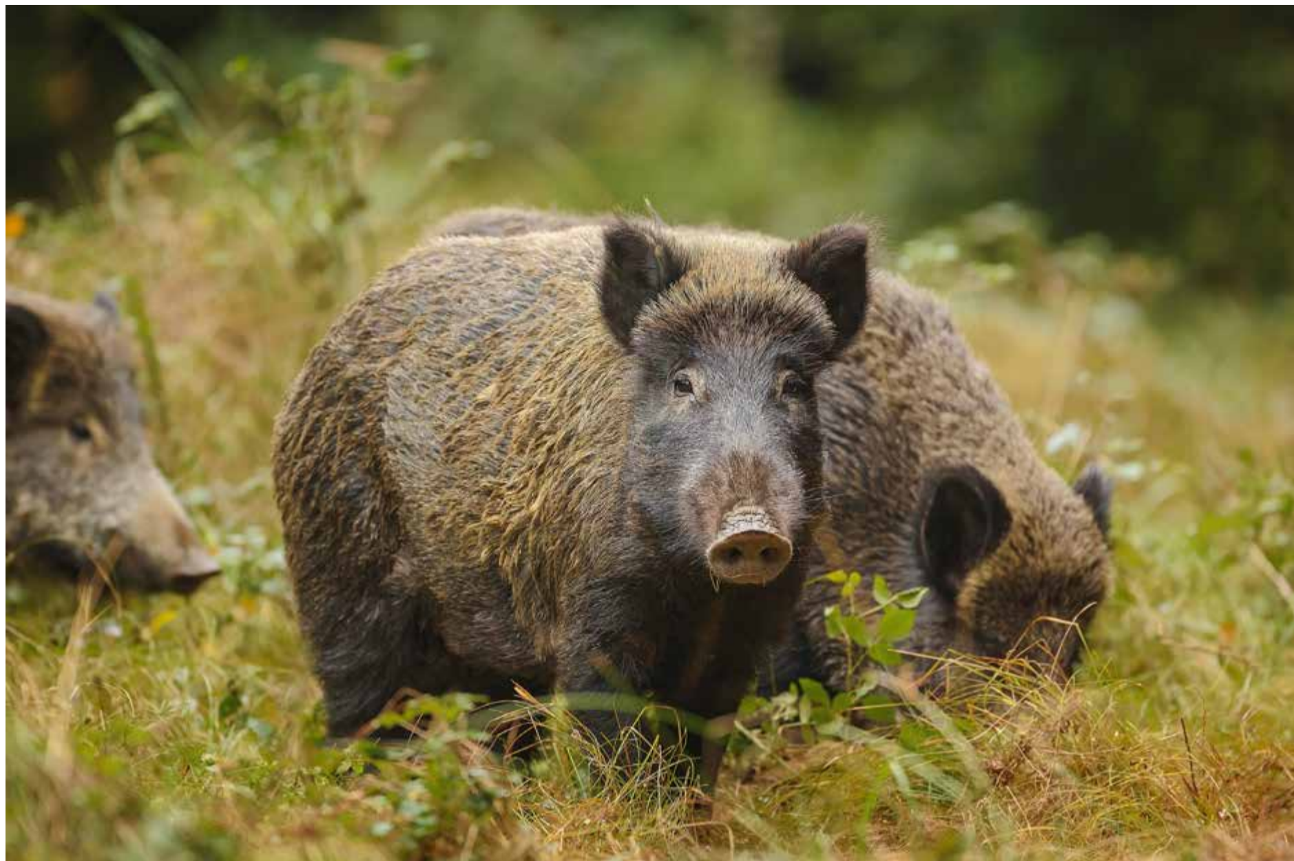
Nu ökar vildsvinsstammen och sprider sig norrut. Direktförsäljning av kött skulle kunna öka viljan att jaga och att hålla stammen hanterbar.