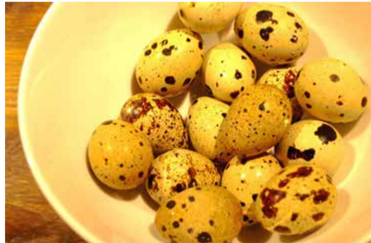
Vaktelägg är vackra. Men utseendet, från samma ras, familjetrad kan variera, ibland blir äggen gröna.

– Inriktningen är en ren produktion, utan kemikalier och tillsatser. Vi köper ekologiskt foder från Lantmännen där vi har ett bra samarbete så vi har koll på exakt vad det innehåller. Vi får mala fodret till en finare blandning för att vaktlarna ska kunna äta. Däremot får vi inte KRAV-certifiera vår