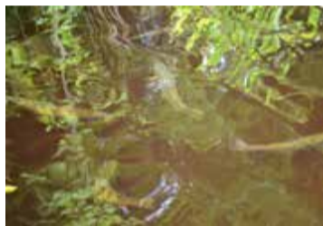
I naturligt grävda dammar med strandväxtlighet simmar kilofisken som nu är leveransklar.