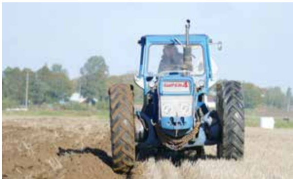
Ford County Super fyra var en udda fågel. Byggt på Ford 5000 med en ovanlig fyrhjulsdrift.