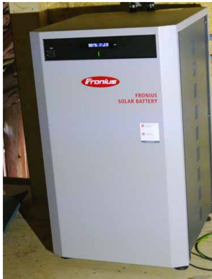
Batteriet från Fronius kostar cirka 150 000 med kringutrustning.

– På det här sättet jämnar man ju ut toppar och bottnar i solelproduktionen. Dessutom kan batteriet bli användbart av helt andra skäl. Flera elnätsägare planerar att ersätta den rörliga nätavgiften med en effektdebitering. Det innebär att man istället för en rörlig avgift låter den timme på dagen när man förbrukar som mest sätta priset för nätavgiften. Solceller i kombination med ett batteri skulle kunna hjälpa till att kapa eventuella toppar i förbrukningen av inköpt el.