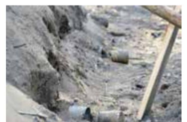
Rören leder in luft under milan

Sedan började man successivt använda stenkol. Trots det ökade kolningen successivt fram till andra världskriget, för att kulmine-