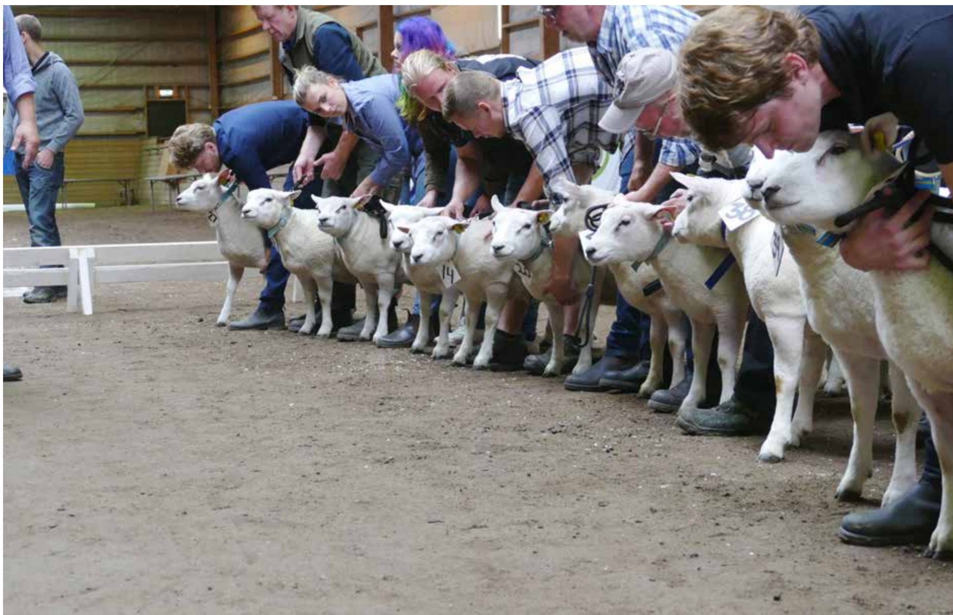
Texel används ofta som faderdjur i lammköttproduktion. De flesta baggar på auktionen, och den dyraste, var också av rasen Texel.