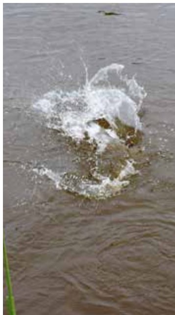
Litet pellets på ytan och dammar kokar av hungriga fiskar.