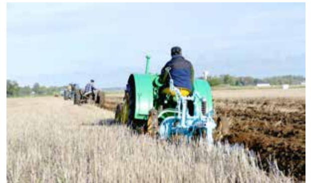
En gammal John Deere BR med bogserad Överumpsplög.