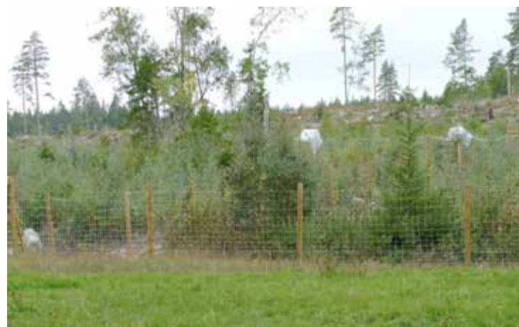
Hägnen bjuder på varierad terräng. I bakgrunden skimtar foderautomaterna

- Tanken är inte alls att det ska ske uppfödning här. Det är ett rent träningshägn. Vi har tre avdelningar för lite olika terräng, lite olika metoder. Vi har valt terrängen, platsen, med omsorg. Det finns både tät granskog, sot-skog, hygge, kärrmark samt lite glesare skog. Allt för att täcka in de flesta situationer man kan stöta på med sin hund när man jagar ute i det fria. En av dem är helt avsedd för nybörjarhundar, mark