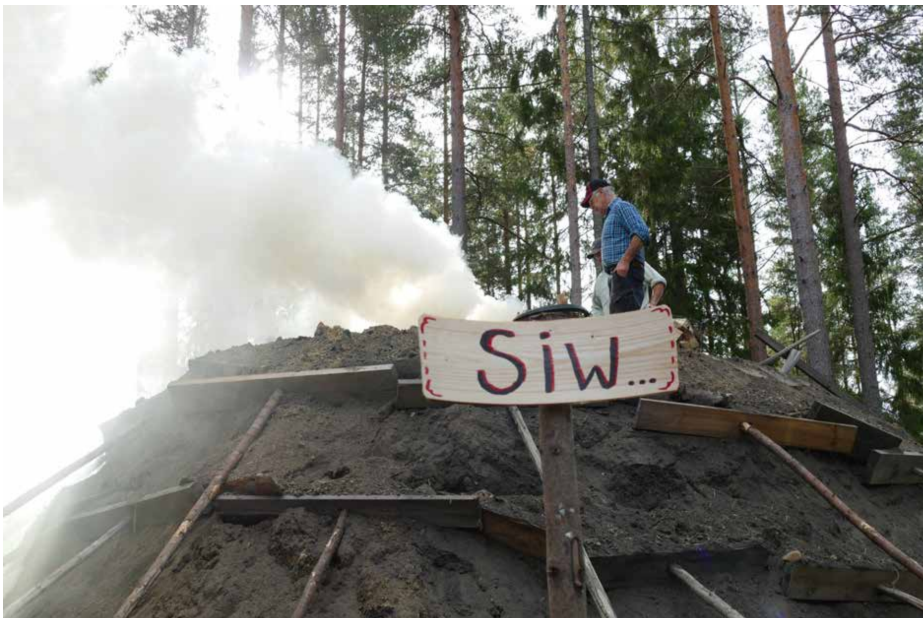
Alla milor ska ha ett kvinnonamn. Denna är döpt efter en av föreningens eldsjälar, hon som bakar godast kakor.