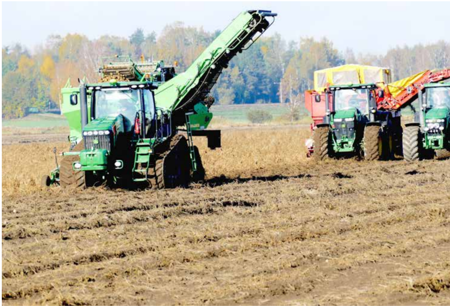
Det blir långa dagar när potatisen ska upp, Upptagarna rullar mellan sju på morgonen till åtta på kvällen.