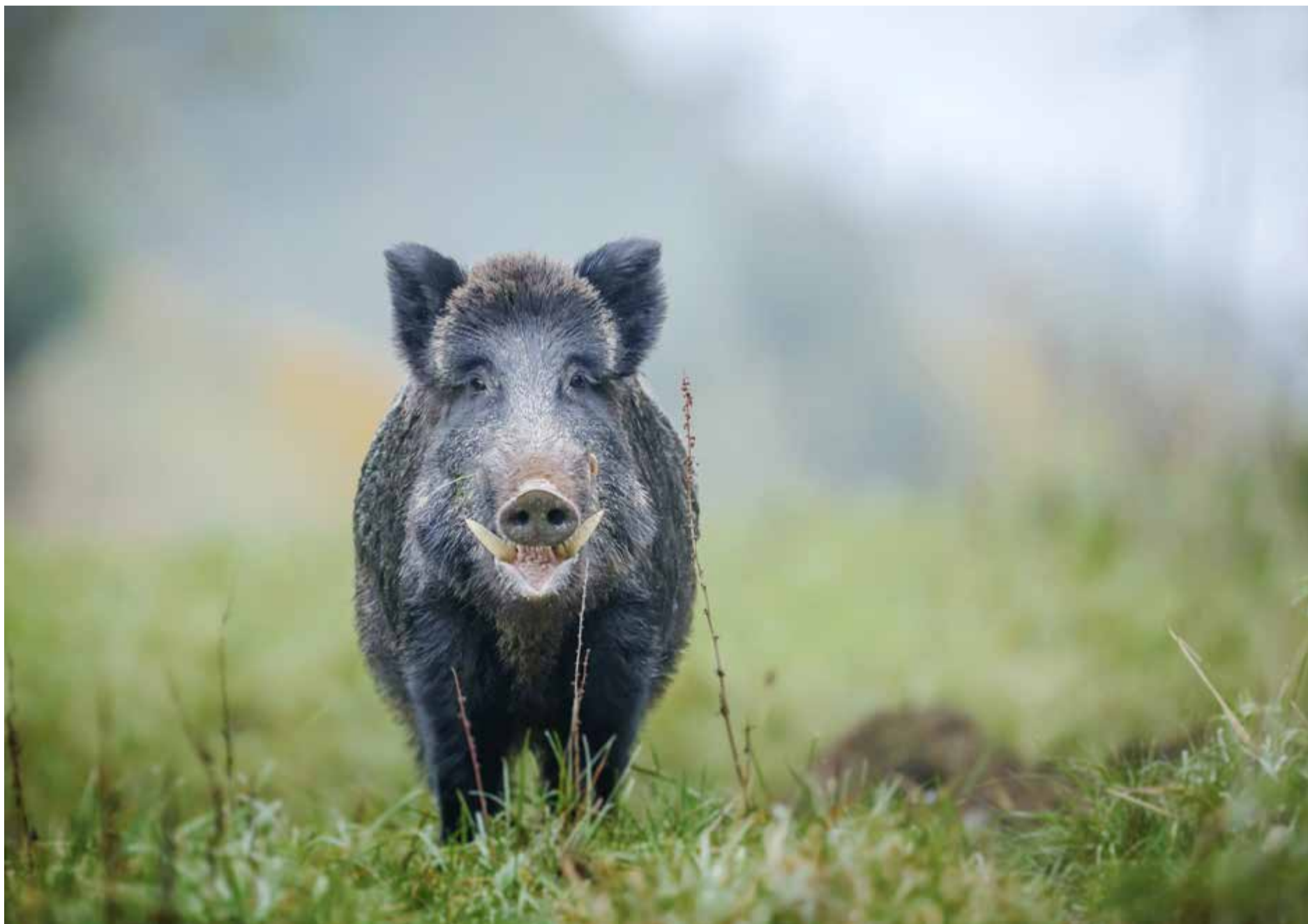
Att jaga vildsvin effektivt är inte lätt. Många menar att samordning över större områden är nyckeln till lyckad förvaltning. I Viby kör man samordnad jakt.