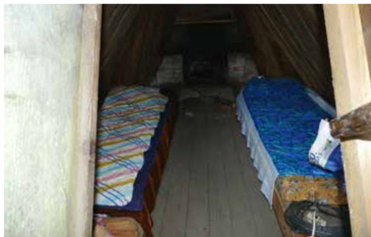
Interiör från Kolarkojan.

Kolningen slukade så enormt med trä att stora delar av landskapet helt enkelt var helt avskogat. Det har troligen aldrig funnits så