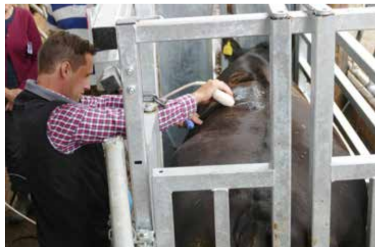
Anders rakar av lite hår för att få bättre kontakt. Proben som hålls mot huden är det som skiljer från när man exempelvis scannar kvinnor, eller tackor, för att se om det finns foster i livmodern.

I dag betalar inte slakterierna för marmorering, med få undantag. Närkes slakteri och Kalmar Slakteri värderar marmorering. Men flertalet slakterier funderar kring hur marmorering ska kunna bli en del av kvalitetsklassningen.