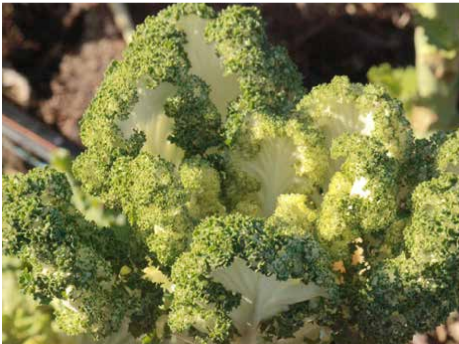
Vacker och ståtlig trotsar den vitgröna kålen frosten.

Slipp snökedjorna! - Oslagbar livslängd och funktion!