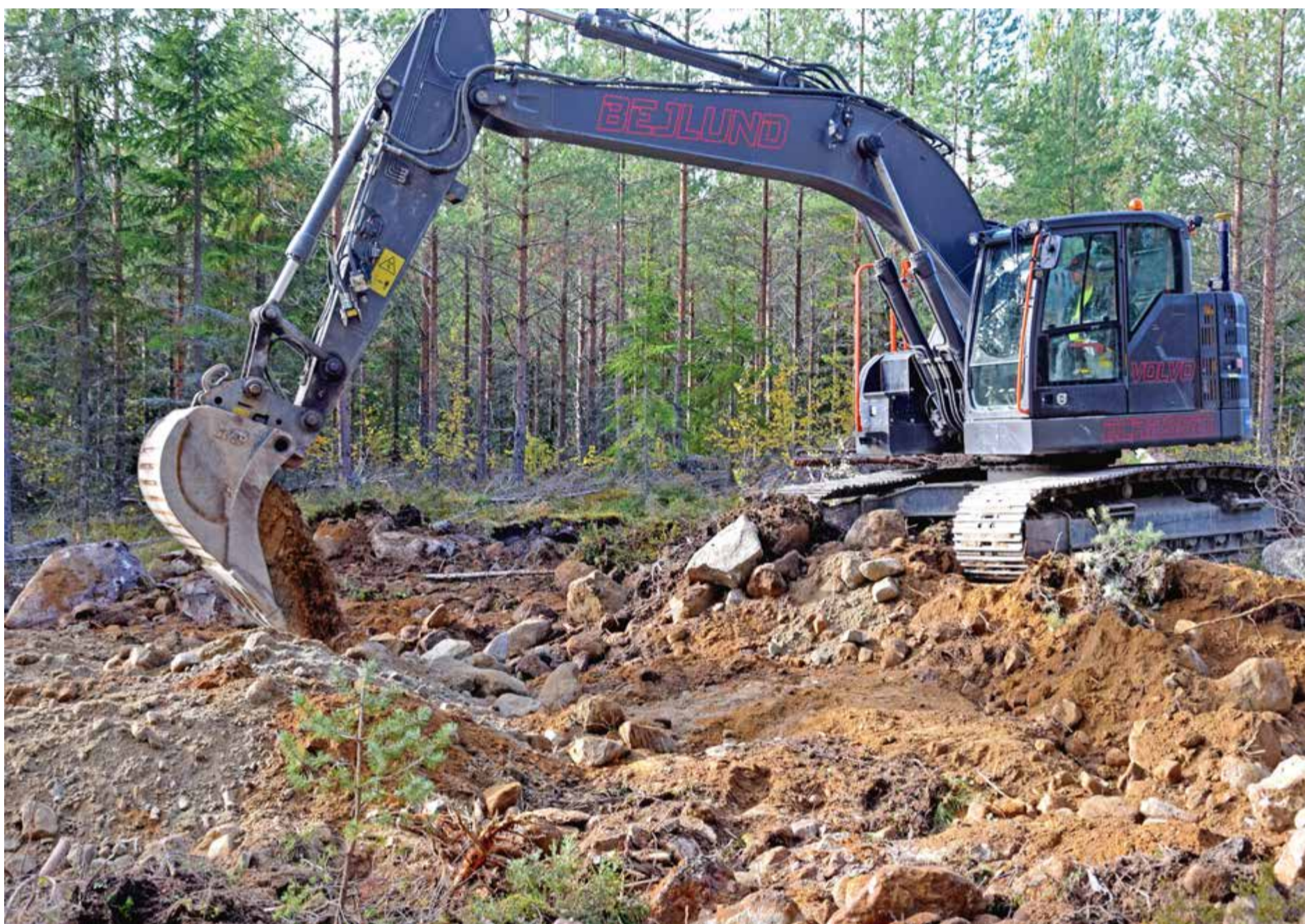
Meter för meter växer den nya skogsvägen fram.