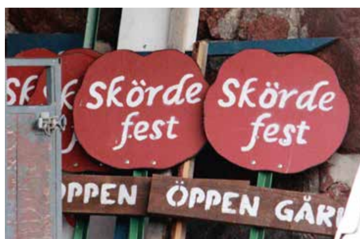
Skytarna undanställda för den här gången. Mer än 1 000 personer ute på gårdsnivå är engagerade under skördefesten på Åland.