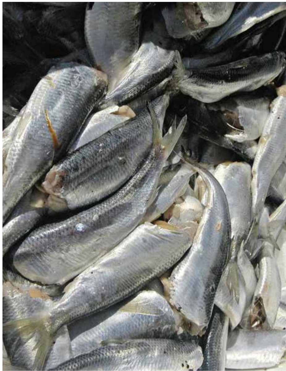
Strömmingen kan inte säljas utomlands men ett förbättrat vatten kan ändra på det.