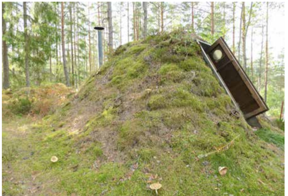
Här inne sover kolarna.

av stroke, så jag är lite vinglig. Därför är jag inte med hela tiden, säger han.