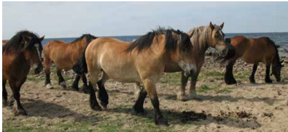
Även hästnäringen pressas av höga kostnader till följd av torkan och grovfoderbristen. Det finns till och med ridklubbar som lägger ner.

"Gräsfrö- och baljväxthalm är restprodukter från vallfröodling och ärtskörd och kan näringsmässigt liknas vid sent slaget hö med låg proteinhalt. Cecilia påpekar dock vikten av att man, oavsett typ av alternativt grovfoder, gör en analys. Framförallt kan helsädesensilage innehålla för mycket stärkelse, ett ämne som hästar har svårt att bryta ner. Resultatet av för mycket stärkelse kan i värsta fall leda till diarré, kolik eller fång."