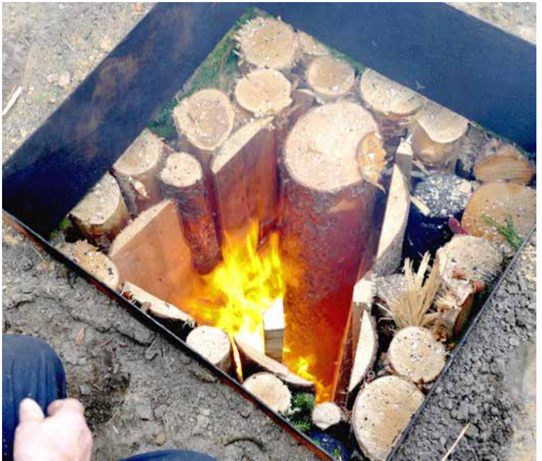
Här har det tagit sig nere i trumman. Nu ska mer ved på. Efter hand stängs luckan och tätas.