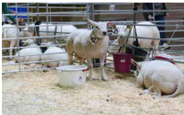
En Texelbagge har ett speciellt utseende, med ett brett huvud.