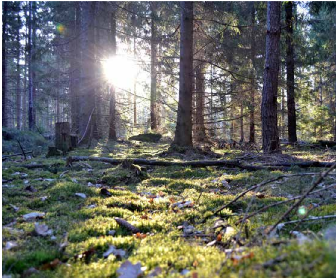
Debattörerna vill ett kraftfullt ledarskap som tryggar äganderätten i Sverige och möjliggör fortsatta investeringar i skogen.